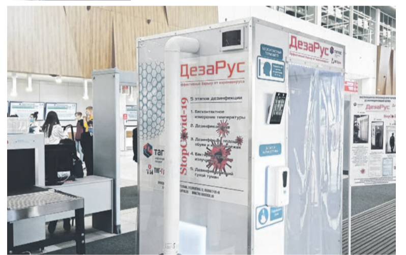
мероприятия встречали дезинфицирующие шлюзы «ДеЗаРус», произведённые в «ТНГ-Универсал».