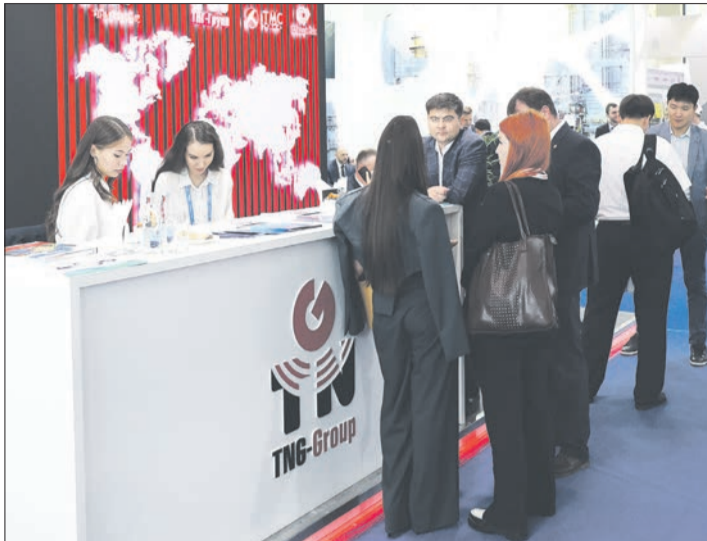
На стенде ТНГ-Групп в Ташкенте. Выставка OGU 2023

Параллельно с казанской выставкой в Ташкенте работала международная выставка