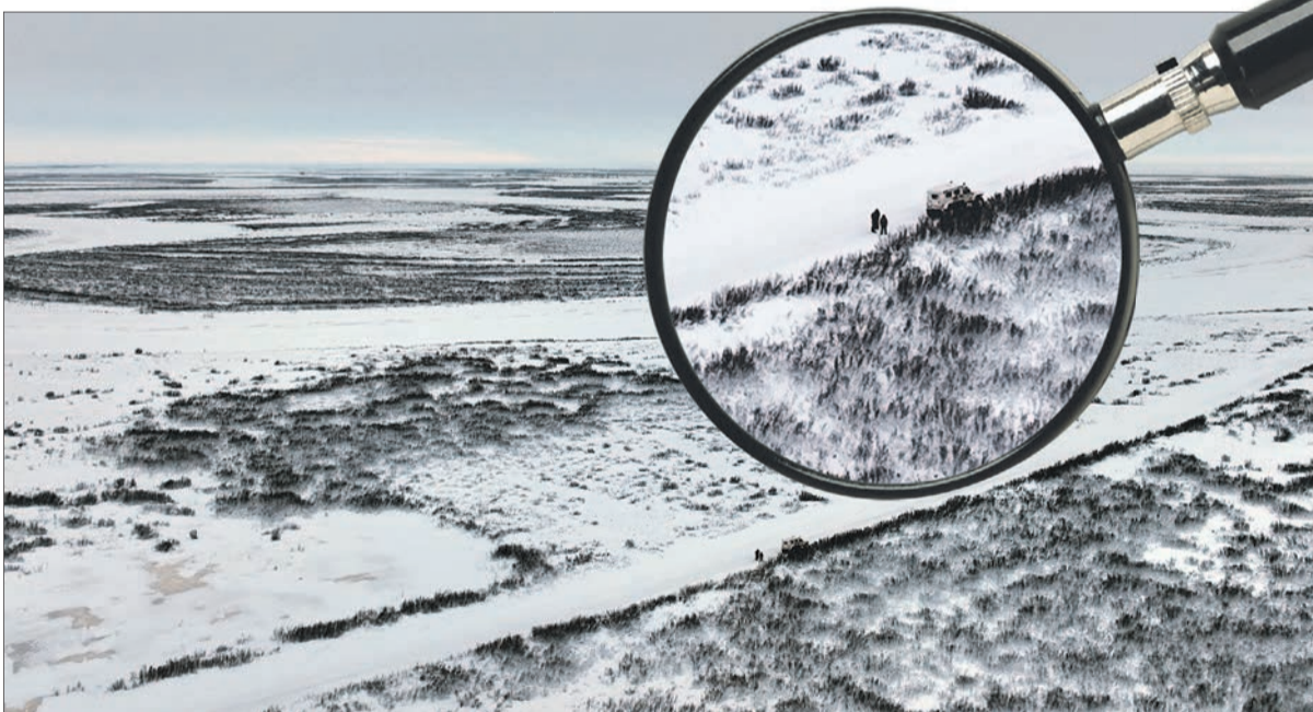
Рекогносцировка с помощью квадрокоптера

В прошедшем зимнем полевым сезоне сейсморазведочная партия № 1 «ТНГ-Юграсервис» выполняла производственные