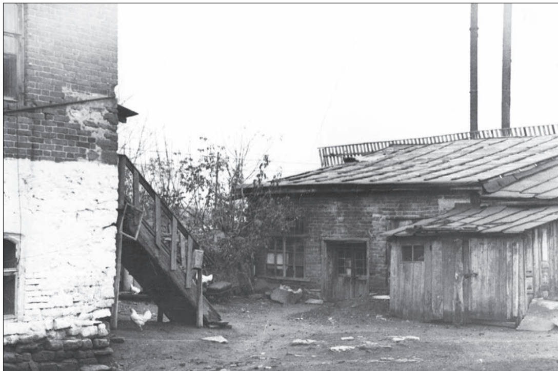
Это фото было сделано в 1951 году. На нём ремонтная мастерская Бугульминской геофизической конторы треста «Башнефтегеофизика», располагавшаяся на улице Советской, ныне улице Ленина. В 1953 году адрес: Советская, 52 был занесён в документ о государственной регистрации как адрес нового треста — «Татнефтегеофизика»