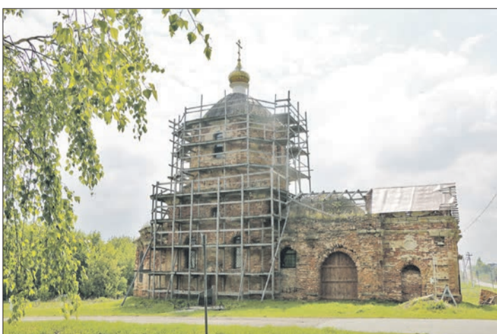
Храм Вознесения Господня сегодня